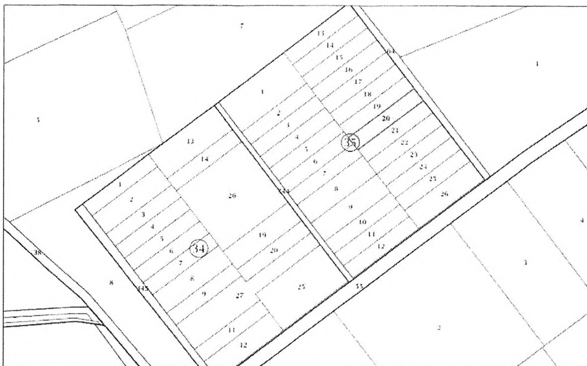
Фиг.2 Извадка от КК на района на ИП

На фиг. 2 е представена извадка от кадастралната карта на района, с местоположението на площадката.