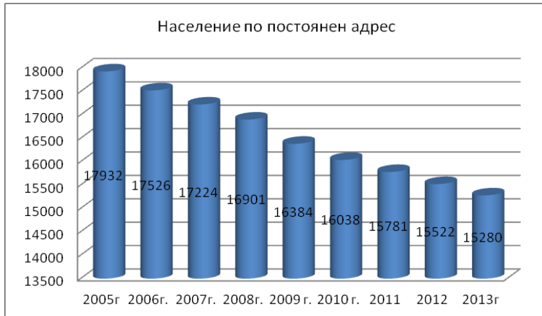
Таблица 1. Население на община Полски Тръмбеш

Проследявайки демографското развитие за периода 2006-2013 г. е видно, че в община Полски Тръмбеш има отрицателен прираст на населението.